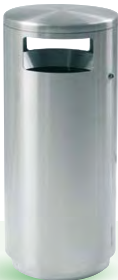
HELVETIAbin, 60 Liter freistehend mit Ascher