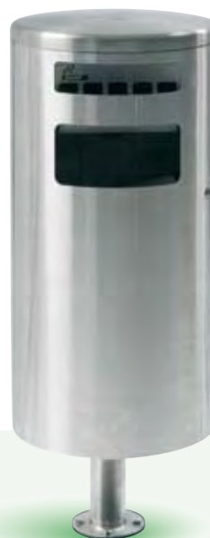
HELVETIAbin, 35 Liter hängend mit Ascher