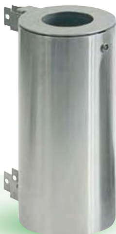
BASEL, 40 Liter freistehend