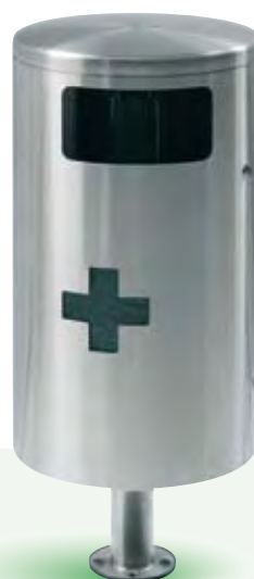
HELVETIAbin, 35 Liter hängend ohne Ascher, mit Hundebox