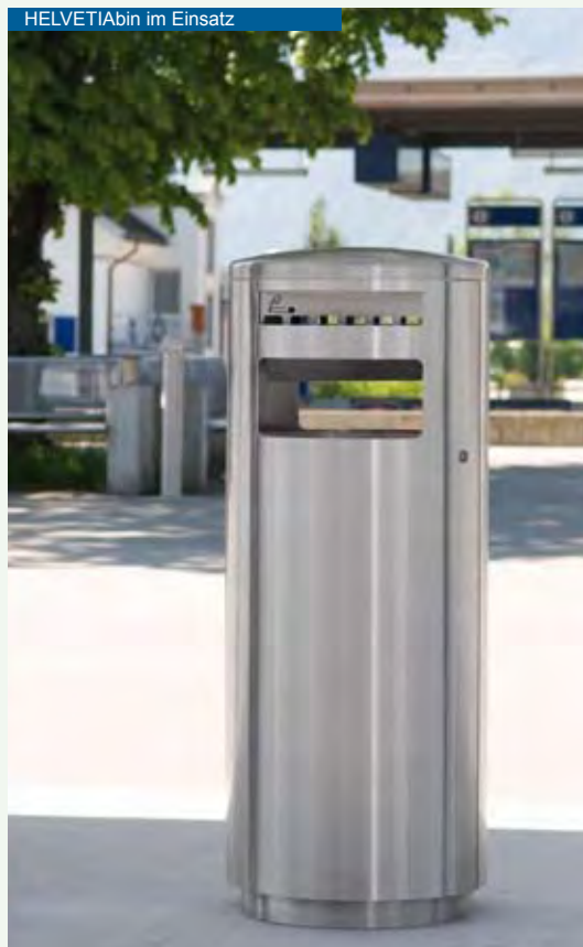
HELVETIAbin im Einsatz

Detailliertere Informationen zu allen Abfallbehältern finden Sie auf www.helvetiabin.ch