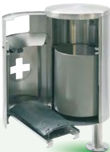
HELVETIAbin, 35 Liter hängend ohne Ascher, mit Hundebox offen