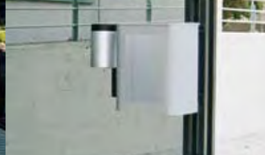
Abfallbehälter und Ascher Wandmontage