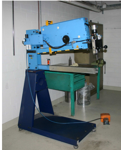
Eckold HC 1000 R

Hit Clinchmaschine zum Durchsetzfügen nach DIN 8593, kurz Clinchen genannt